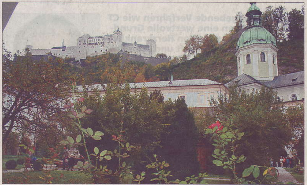
Tausende Besucher nutzten die Gelegenheit die geöffneten Schätze in der Altstadt zu besuchen. Auch im Innenhof von St. Peter tummelten sich die Besucher in der herrlichen Gartenanlage mit besonderem Blick auf die Festung.

Als echte Sensation werden die aktuellen Ergebnisse zur Baugeschichte der Stiftskirche St. Peter bewertet, wo nach neuesten Untersuchungen ein Mauerwerk aus dem 8. Jahrhundert stammt. Im heutigen Mittelschiff der Kirche wurden 10 Meter über dem Kirchenboden Mörtel- und Holzproben