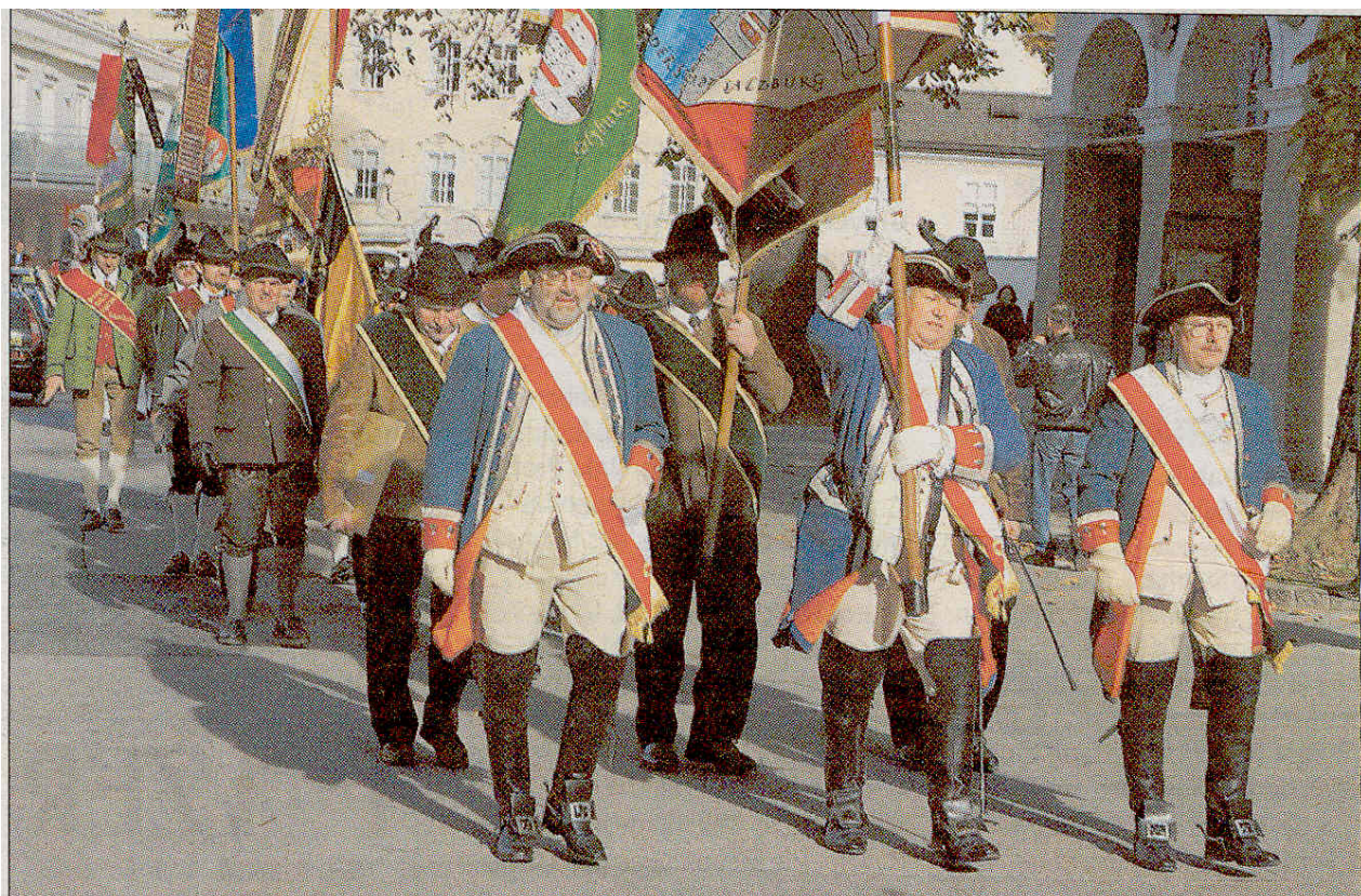
Am Samstag feierte die Bürgergarde Salzburg mit einem Festumzug in der Altstadt das Martinsfest. Vorher hatten sich die Teilnehmer zu einem Festgottesdienst im Dom getroffen.