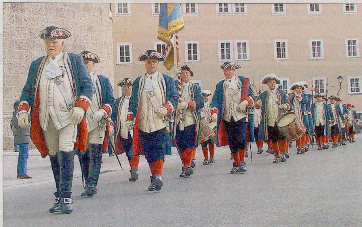
Vergangenen Samstag feierte die Bürgergarde Salzburg mit einem Festzug in der Altstadt das Martinsfest. Zu Ehren des Stadtpatrons fand zuvor ein Festgottesdienst im Dom statt. Zahlreiche Schaulustige und Touristen begleiteten den Marsch vom Kapitelplatz über den Domplatz und den Residenzplatz trotz klirrender November-Kälte.