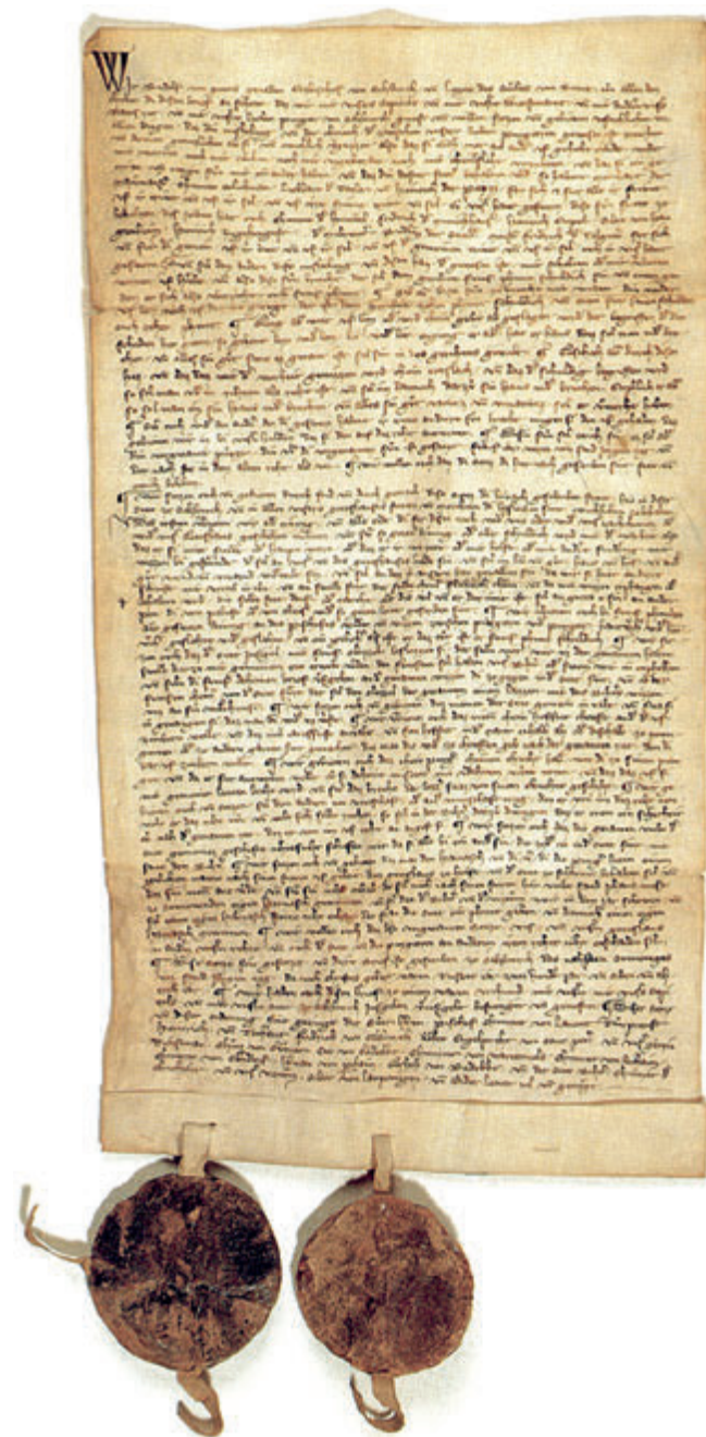
Sühnebrief vom 20. April 1287

Bei Schlechtwetter entfällt die Veranstaltung ersatzlos.