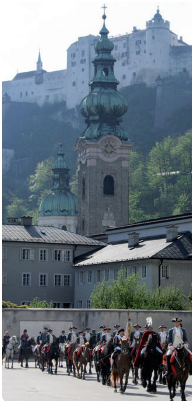
Georgi-Ritt auf die Festung Hohensalzburg